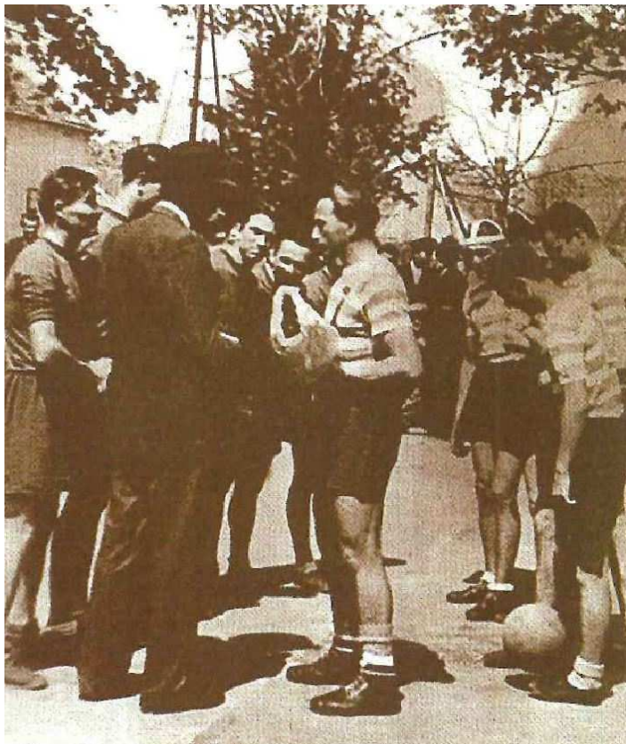
Pocetak utakmice Radicki Zrenjanin- Metalac Beograd 1946