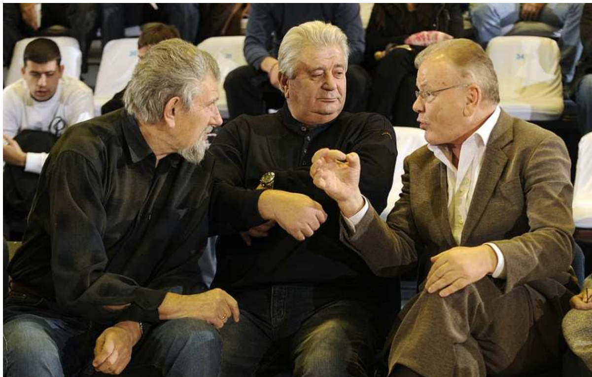
Nemanja Djurić, Radovan Radović | Dusan Ivković na Evropskom Prvenstvu 2005 u Beogradu

Radovan Bata Radovic je rođen 19 januara 1936 godine u Kucevu, Jugoslavija, u vreme dok mu je porodica bila tamo na službi/terenu, inače su živeli u Beogradu. Otac Marko rođen u Cetinju, poreklom iz Donje Morace iz rodoslova u kome je I Amfilohije Radovic, tako da Bata vuče korene iz tih krajeva.