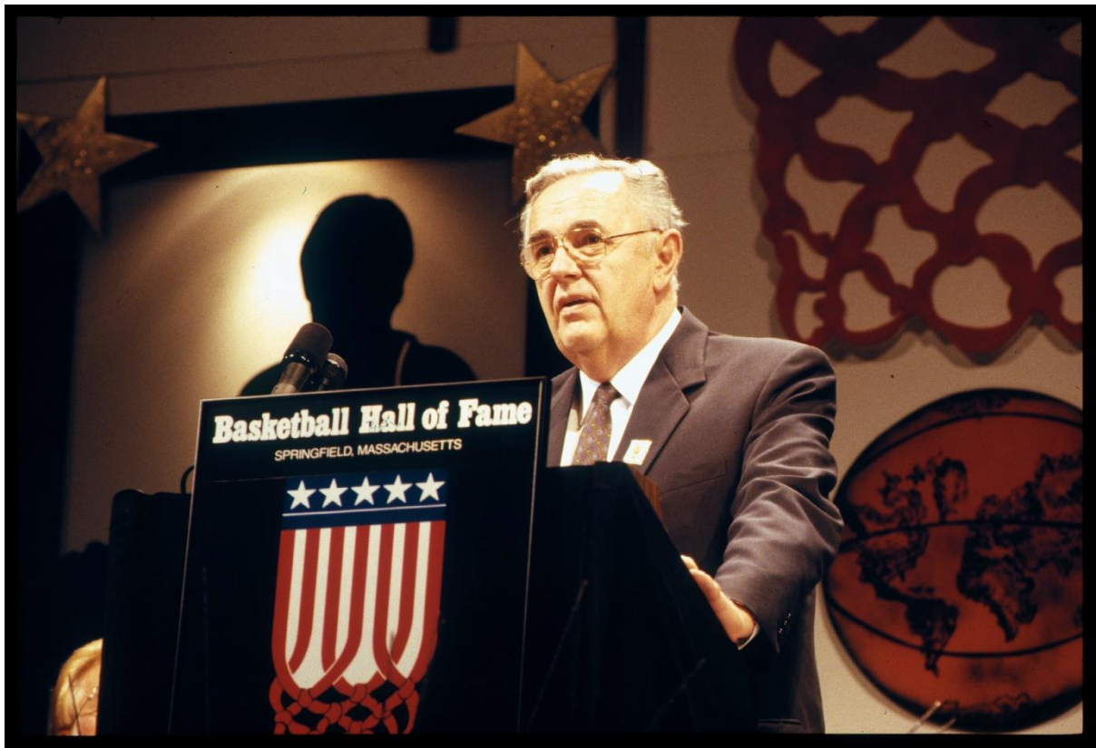
Inaguracija u Nejsmitovu kuću slavnih u Springfieldu (Masačusets, SAD), 1991 godina