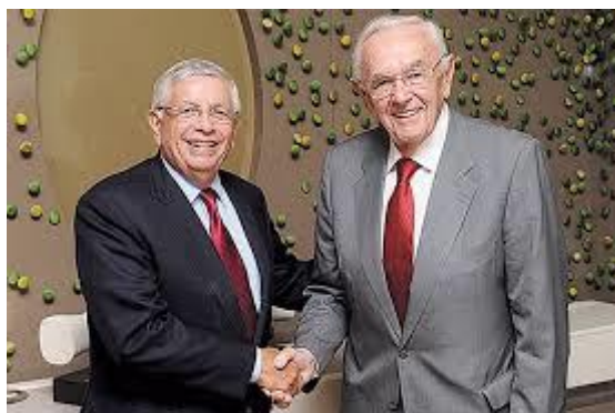
David Stern, Bora Stanković

Džons i Bora su imali viziju, o jedinstvenoj svetskoj košarci. Ispostavilo se da su od toga koristi imali i Fiba i košarka. Na kraju je Bora, na Kongresu u Minhenu 1989, isterao tu svoju priču o ujedinjenju i dobili smo profesionalce na olimpijadi.