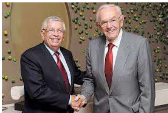
David Stern, Bora Stanković

Džons i Bora su imali viziju, o jedinstvenoj svetskoj košarci. Ispostavilo se da su od toga koristi imali i Fiba i košarka. Na kraju je Bora, na Kongresu u Minhenu 1989, isterao tu svoju priču o ujedinjenju i dobili smo profesionalce na olimpijadi.